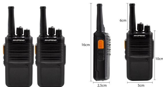
PESO: 159g (com bateria e antena)